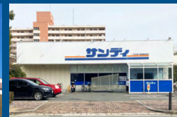
サンディ 尼崎長洲店(徒歩6分/約460m)