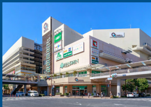
あまがさきキューズモール(徒歩5分/約370m)