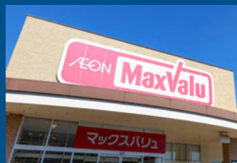
マックスバリュ 金楽寺店(徒歩5分/約340m)