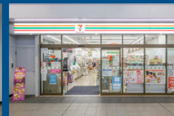
セブンイレブン ハートインJR尼崎駅東口改札口店(徒歩2分/約110m)