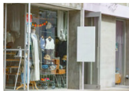
尼崎駅周辺イメージ