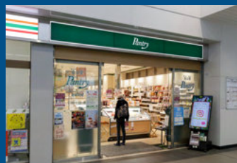
パントリー JR尼崎駅店(徒歩2分/約110m)