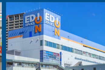
エディオン JR尼崎駅店(徒歩2分/約160m)