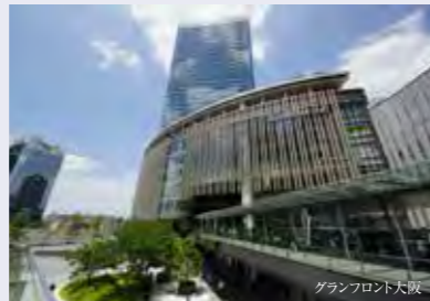
グランフロント大阪

徒歩2分のJR「尼崎」駅から「大阪」駅へは1駅5~7分。わずか 10分足らずで、ビジネス、ショッピング、グルメなど都心を自由自在に 使いこなす、便利な日常がはじまります。多彩なショップやエンター テインメントが楽しめる「グランフロント大阪」をはじめ、大阪駅直結 の複合商業施設「ルクア大阪」へもスムーズにアクセスできます。