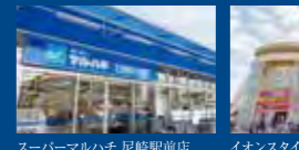
スーパーマルハチ 尼崎駅前店(徒歩9分/約720m)