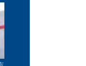
コストコホールセール 尼崎倉庫店(徒歩30分/約2,370m)