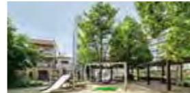
長洲本通北公園(徒歩5分/約370m)