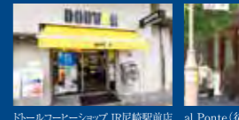
ドールコーセーショップ JR尼崎駅前店(徒歩1分/約290m)