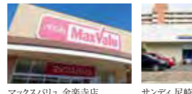
マックスバリュ 金葉寺店(徒歩5分/約340m)