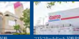
イオンスタイル尼崎(徒歩25分/約1,980m)