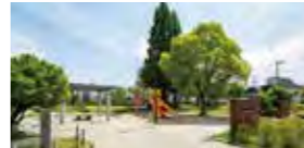
さくら公園(徒歩12分/約900m)