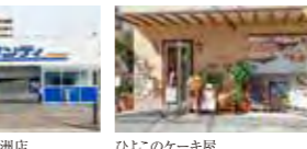
サンディ 尼崎長洲店(徒歩6分/約460m)