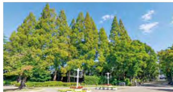
尼崎市記念公園(徒歩9分/約690m)

JR「尼崎」駅の南側は緑豊かな公園が点在する、駅前ながら穏やかな暮らしが楽しめるエリア。駅直結の大型家電量販店「エディオン」をはじめ、スーパーマーケットや飲食店も生活圏に充実しています。