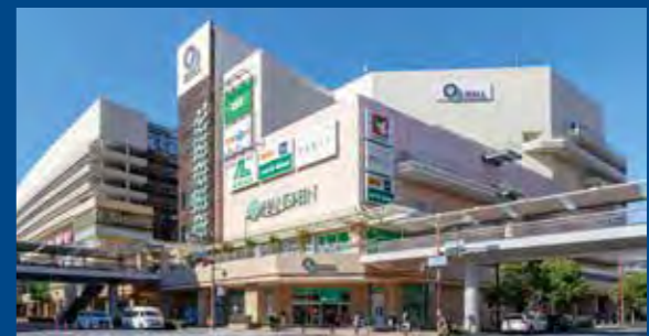
あまがさきキューズモール(徒歩5分/約370m)

百貨店やスーパー、専門店、グルメなど多彩なラインナップのあまがさきキューズモールへは徒歩5分。屋根のあるデッキだから雨の心配なく、日々のショッピングシーンのもとより、仕事帰りの飲食や週末のひとつときなどを豊かに演出してくれます。