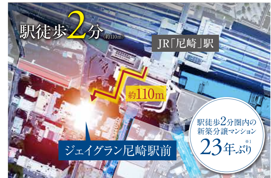
現地周辺航空写真