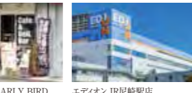
CAFE&DELI EARLY BIRD(徒歩8分/約610m)